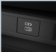
センターコンソール前部1個 (Type-C)