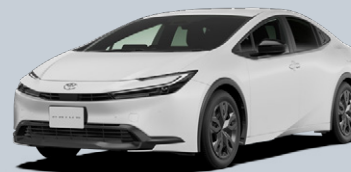
スーパーホワイトⅡ<040>