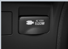
センターコンソール後部

アクセサリーコンセント (AC100V・1500W/非常時給電システム付/センター コンソール後部1個・ラゲージルーム左側1個)