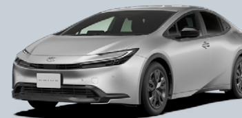
シルバーマトリック<110>