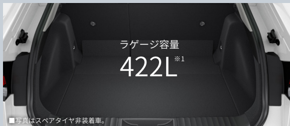
■写真はスペアタイヤ非装着車。