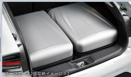
■スーツケース2個収納イメージ※2

※1. VDA法による社内測定値。スペアタイヤ装着車は荷室容量が異なります。 ※2. スーツケースのサイズや形状によっては収納できない場合があります。詳しくは販売店にてご確認ください。 ■装備額の詳しい設定につきましては、主要装備一覧表をご覧ください。