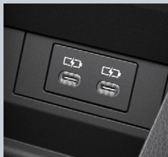
センターコンソールボックス内側2個 (Type-C)