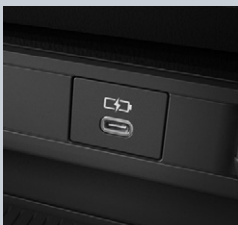
センターコンソール前部1個 (Type-C)