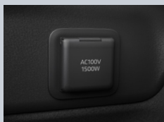
ラゲージルーム左側