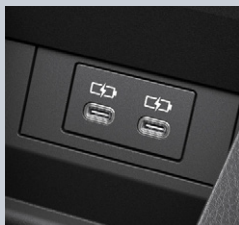
センターコンソールボックス内側2個 (Type-C)