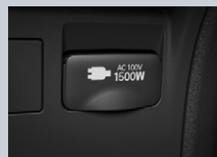
センターコンソール後部

アクセサリコンセント (AC100V・1500W/非常時給電システム付/センターコンソール後部1個・ラゲージルーム左側1個)