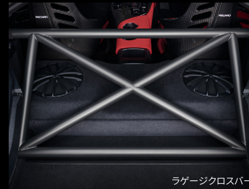
ラゲージクロスバー