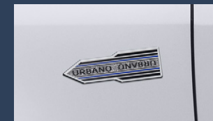
▶フェンダーエンブレム