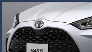
▶トヨタマーク (ブラック/フロント&リヤ)