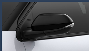
▶LEDサイドターンランプ付 オート電動格納式リモコンドア ミラー(ブラック/ヒーター付)