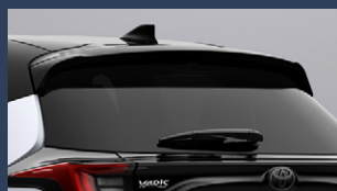
▶リヤルーフスポイラー (ブラック)