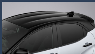
▶ツートーンルーフ(ブラック)