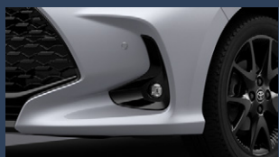
▶LEDフロントフォグランプ