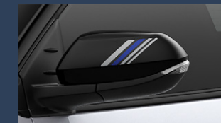
▶ドアミラーステッカー

※ステッカー周辺への高圧洗浄は行わないで ください。ステッカー剥がれの原因となります。