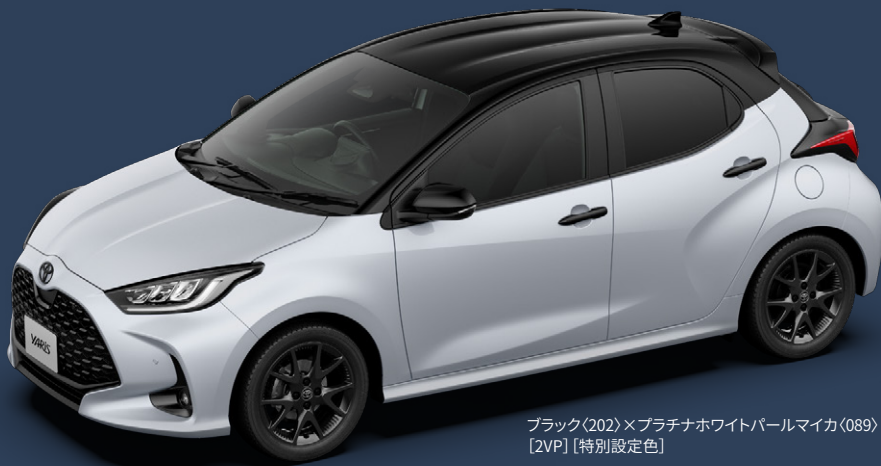
ブラック(202)×プラチナホワイトパールマイカ(089) [2VP]【特別設定色】

ブラックーフのツートーン。プラチナホワイトパールマイカは特別設定色、マッシュグレーも存在感抜群。