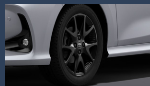
▶185/55R16タイヤ&16×6J アルミホイール(グロスブラック 塗装/センターオーナメント付)