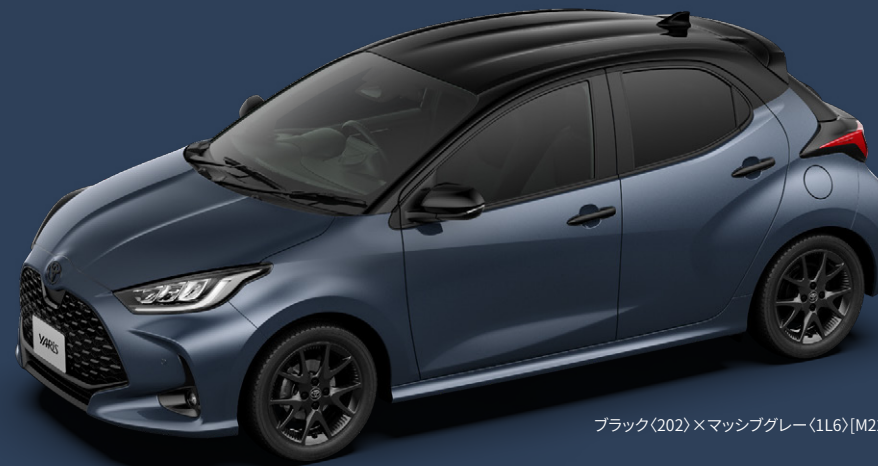
ブラック(202)×マッシュグレー(1L6)[M22]