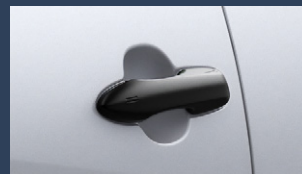
▶アウトサイドドアハンドル (ブラック)