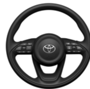
●ウレタン3本スポーク ステアリングホイール