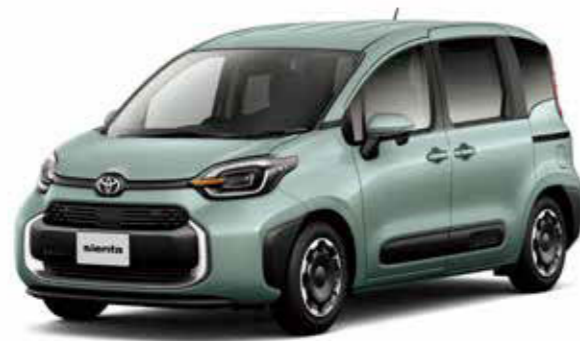
Photo: Z (ハイブリッド・2WD・7人乗り)。ボディカラーはアーバンカーキ (6X3)。内装色のフロマージュは設定色 (ご注文時に指定が必要です。指定がない場合はブラックになります)。