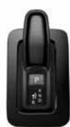
●エレクトロシフトマチック [ハイブリッド車]