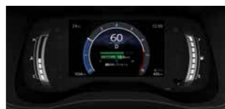
●オペティロンメーター+7.0インチ TFTカラーマルチインフォメーション ディスプレイ [ガソリン車]