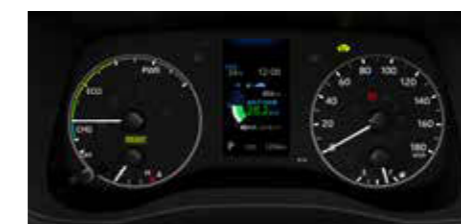
●アナログメーター +4.2インチTFTカラーマルチイン フォメーションディスプレイ [ハイブリッド車]