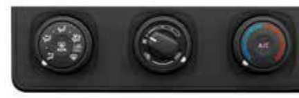
●マニュアルエアコン&ヒーターコントロールパネル [ガソリン車]