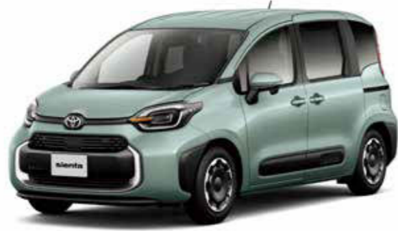
Photo: Z (ハイブリッド・2WD・7人乗り)。ボディカラーはアーバンカーキ〈6X3〉。内装色のフロマージューは設定色(ご注文時に指定が必要です。指定がない場合はブラックになります)。