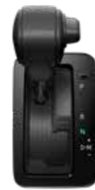
●10速シーケンシャルシフトマチック付 ストレート式シフトレバー [ガソリン車]