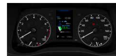
●アナログメーター +4.2インチTFTカラーマルチイン フォメーションディスプレイ [ガソリン車]