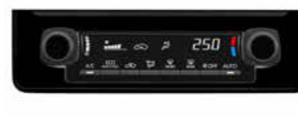
●オートエアコン&ダイヤル式ヒーターコントロールパネル (ピアノブラック) [ハイブリッド車]