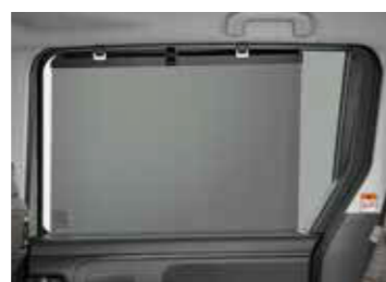
●後席用サンシェード/セラミックドット (スライドアガラス)