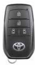
●スマートエントリー (運転席・助手席・バックドア/アンサーバック機能付) & スタートシステム (スマートキー2個) ※写真はハイブリッド車