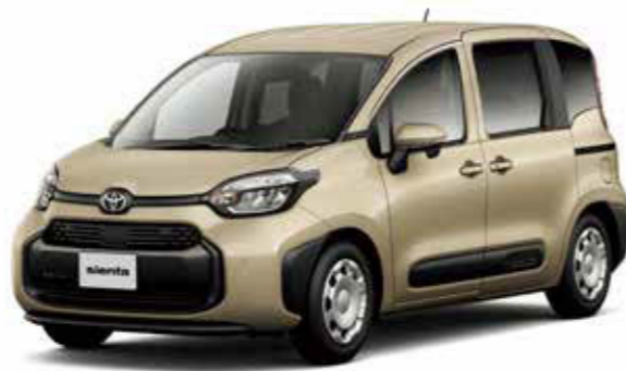
Photo: G (ガソリン・5人乗り)。ボディカラーはベージュ (4V6)。内装色のカーキ (ファンツールパッケージ<0円>) はメーカーパッケージオプション (ご注文時に指定が必要です。指定がない場合はブラックになります)。内装色のカーキ (ファンツールパッケージ) を選択した場合、エクステリアのドアサッシュ (センターピラー) は選択したボディカラーと同色となります。