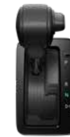
●10速シーケンシャルシフトマチック付 ストレート式シフトレバー [ガソリン車]