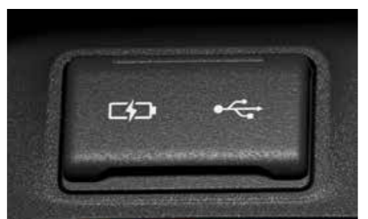
●充電用USB端子 (Type-C) 1個・通信用USB端子 (Type-A) 1個 [シフトサイドポケット前方] + 充電用USB端子 (Type-C) 2個 [運転席シートバック] ●運転席シートバックスマホポケット2個