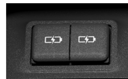
●充電用USB端子 (Type-C) 2個 [シフトサイドポケット前方]