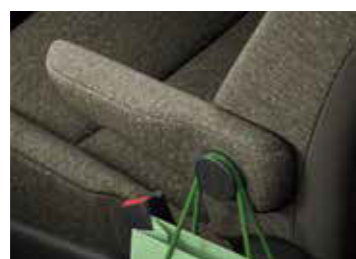
●運転席アームレスト (フック付/左側)