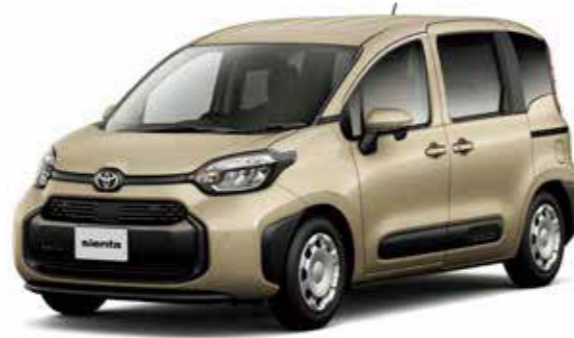
Photo: G (ガソリン・5人乗り)。ボディカラーはベージュ〈4V6〉。内装色のカーキ (ファンツールパッケージ<0円>) はメーカーパッケージオプション (ご注文時に指定が必要です。指定がない場合はブラックになります)。内装色のカーキ (ファンツールパッケージ) を選択した場合、エクステリアのドアサッシュ (センターピラー) は選択したボディカラーと同色となります。