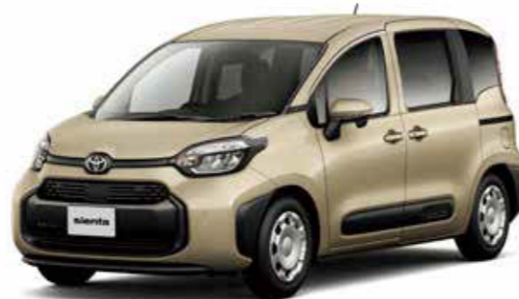
Photo: G (ガソリン・5人乗り)。ボディカラーはベージュ (4V6)。内装色のカーキ (ファンツールパッケージ<0円>) はメーカーパッケージオプション (ご注文時に指定が必要です。指定がない場合はブラックになります)。内装色のカーキ (ファンツールパッケージ) を選択した場合、エクステリアのドアサッシュ (センターピラー) は選択したボディカラーと同色となります。