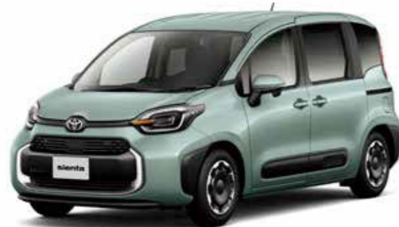
Photo: Z (ハイブリッド・2WD・7人乗り)。ボディカラーはアーバンカーキ (6X3)。内装色のフロアージュは設定色 (ご注文時に指定が必要です。指定がない場合はブラックになります)。