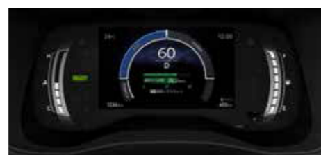
●オペティロンメーター+7.0インチ TFTカラーマルチインフォメーション ディスプレイ [ハイブリッド車]