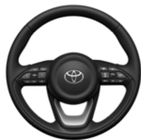
●本革巻き3本スポーク ステアリングホイール (シルバー塗装)