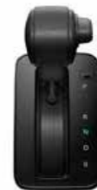
●ストレート式シフトレバー [ハイブリッド車]