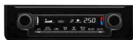
●オートエアコン&ダイヤル式ヒーターコントロールパネル (ピアノブラック)