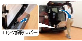
ロック解除レバー

スロープを支えながら ロック解除レバーを 引き、スロープを車外へ 最後まで引き出す