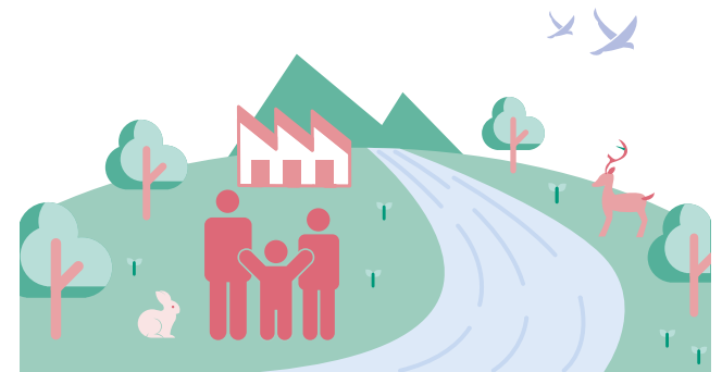
トヨタヤリス 環境仕様

トヨタは、水使用による環境負荷を小さくするとともに、生物の多様性を取り戻すために、自然保全活動の輪を地域・世界とつなぎ、そして未来へつなぐ活動を進めます。