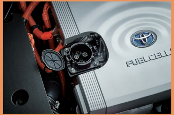
外部給電アウトレット(ボンネット下コンパートメント内)