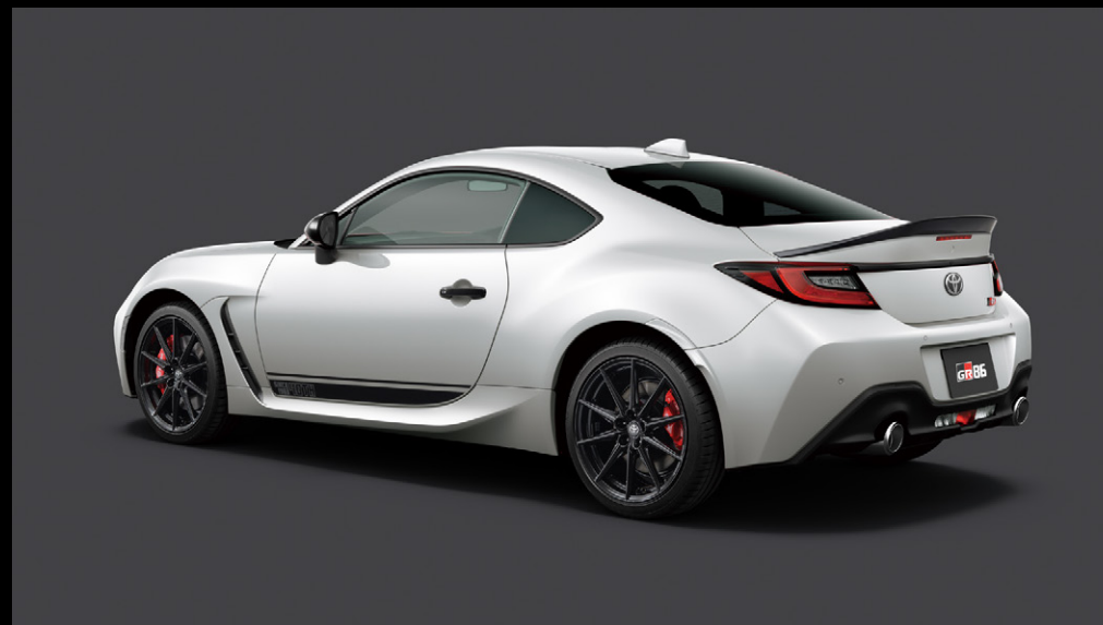
▶ クリスタルホワイトパール〈K1X〉*2