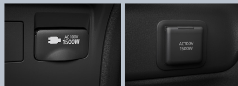
センターコンソール後部 ラゲージルーム左側

アクセサリーコンセント (AC100V・1500W/非常時給電システム付/センターコンソール後部1個・ラゲージルーム左側1個)