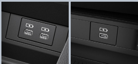
センターコンソールボックス内側2個 (Type-C) センターコンソール前部1個 (Type-C)