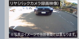
※写真はイメージで当該車両とは異なります。

[設定]ベーシックナビドラレコセットまたはカメラ別体タイプドライブレコーダー(ベーシックナビ連動タイプ)<バックカメラ利用タイプ>付車